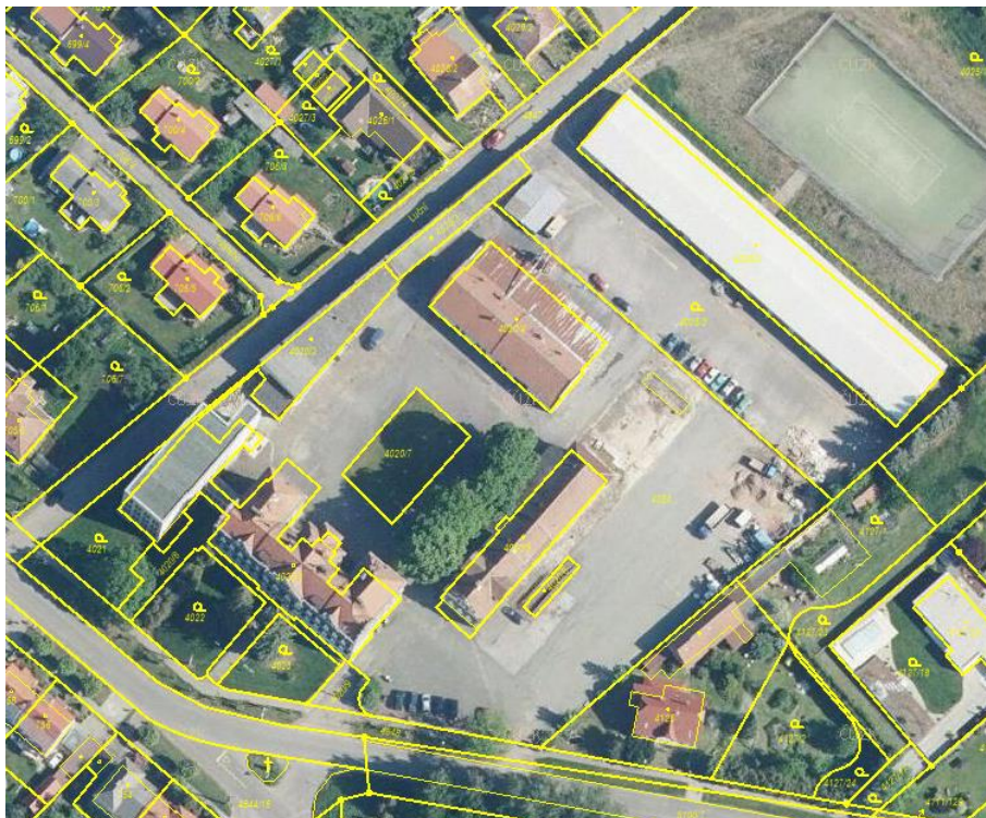
Obrázek 3: Výřez z koordinčního výkresu ÚP Vysoké Mýto