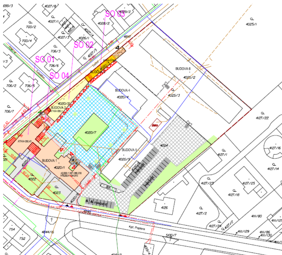
Obrázek 1: Výřez koordinačního výkresu

Přitom bylo zjištěno, že předložený záměr je v souladu s § 19 odst. 1 písm. d) a e) stavebního zákona.